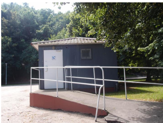
Elewacja boczna z rampą dla osób niepełnosprawnych